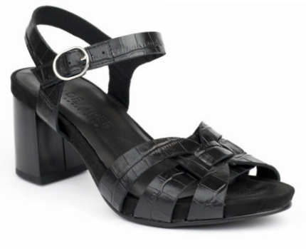
VIOX 5 ■ COCO negro