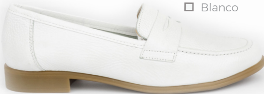
MOKA 4 □ Blanco