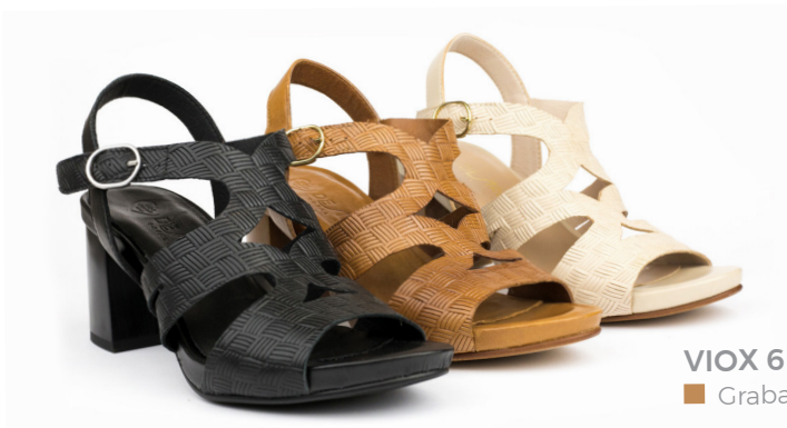
VIOX 6 ■ Grabado torro