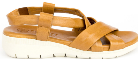
ZENIT 5 ■ Soft cuero