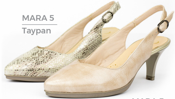
MARA 5 Taypan