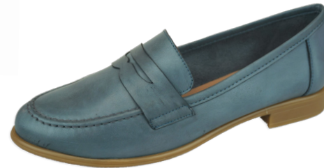
MOKA 4 ■ Azul