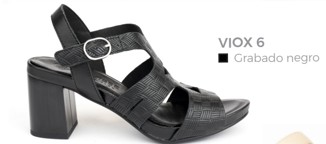
VIOX 6 ■ Grabado negro