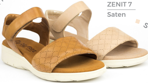
ZENIT 7 Saten