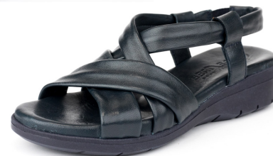
ZENIT 5 ■ Soft marino