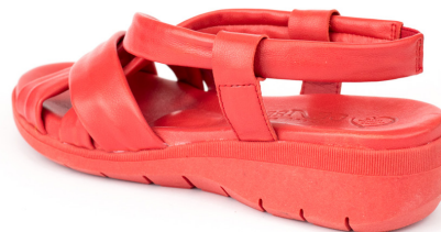
Zenit 5 ■ Soft rojo