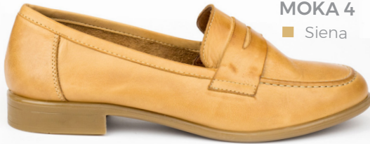
MOKA 4 ■ Siena