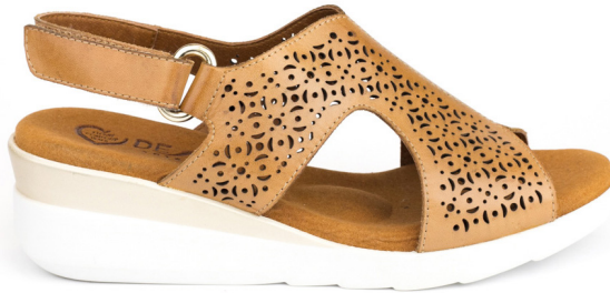
URBI 3 Tex