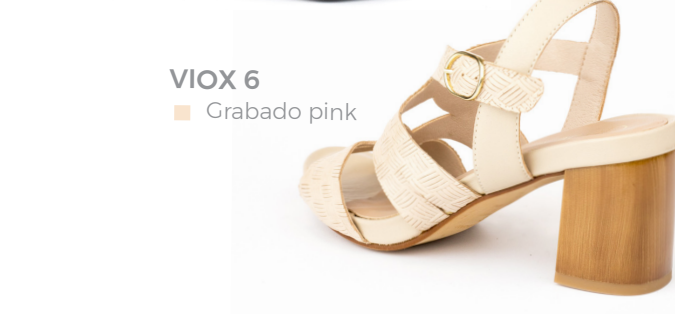
VIOX 6 ■ Grabado pink