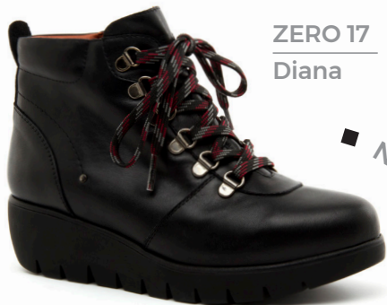
ZERO 17 Diana