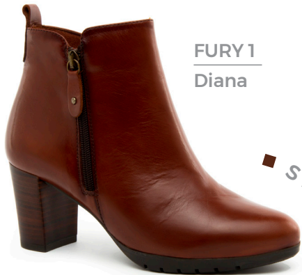
FURY 1 Diana