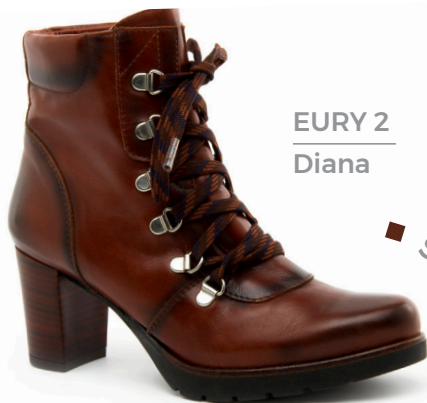
EURY 2 Diana