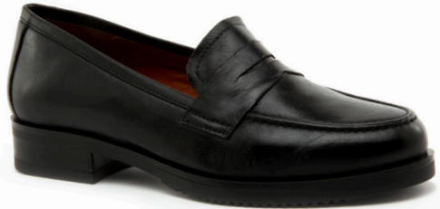
COFI 1 | Diana