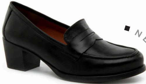
NEUS 3 Diana