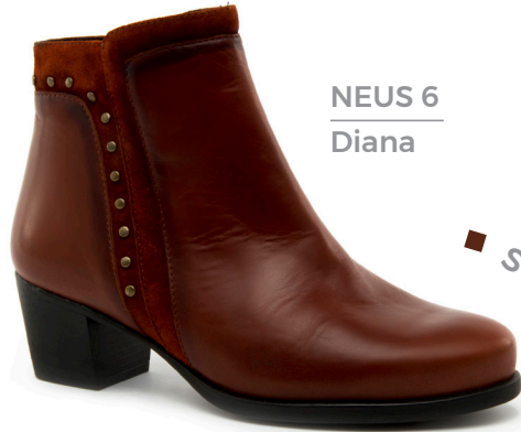
NEUS 6 Diana