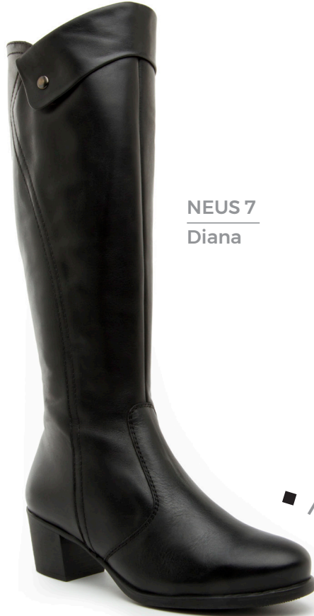
NEUS 7 Diana