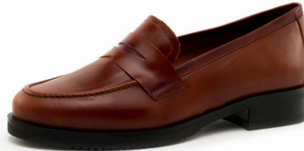
COFI 1 | Diana