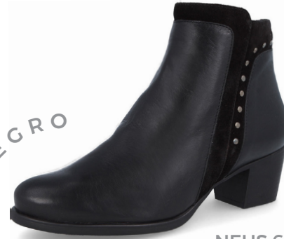
NEUS 6 Diana