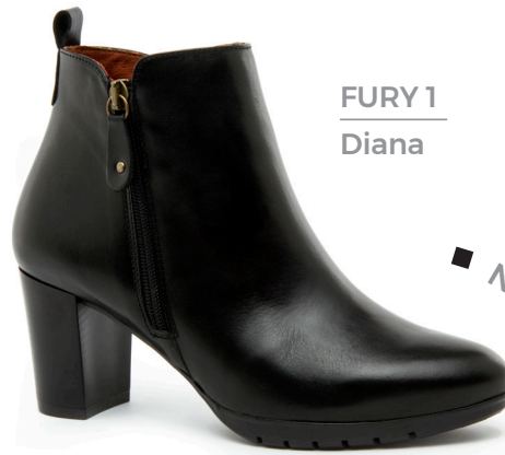
FURY 1 Diana