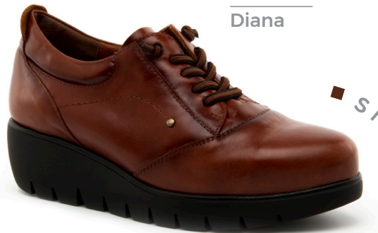
ZERO 14 Diana