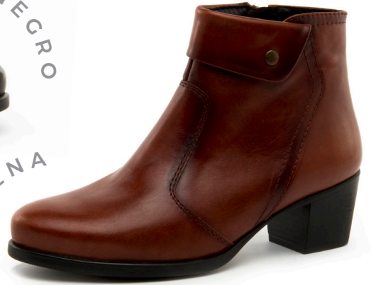
NEUS 2 Diana