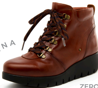
ZERO 17 Diana

Nuestros productos de la línea Zero, tienen plantilla extraíble. Además, se caracterizan por su gran flexibilidad y por su ligereza. La máxima calidad y comodidad para tu día a día.