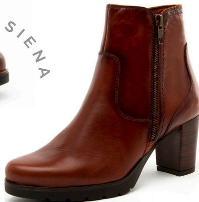
EURY 4 | Diana