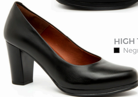
HIGH 1 DIANA