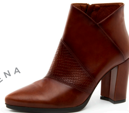
GLAMY 4 Diana Pitone