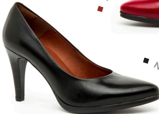
SARA 20 Diana