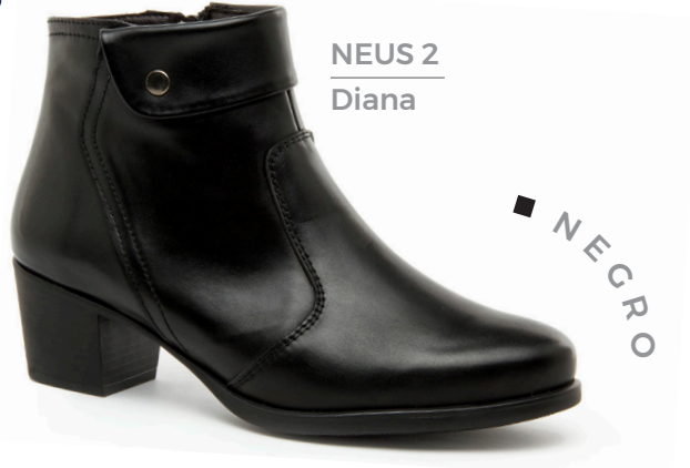
NEUS 2 Diana