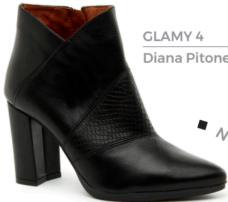
GLAMY 4 Diana Pitone