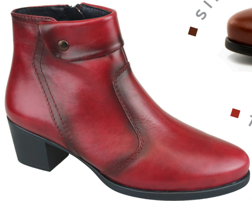
NEUS 2 Diana