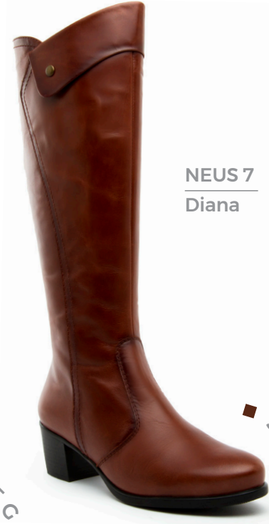
NEUS 7 Diana