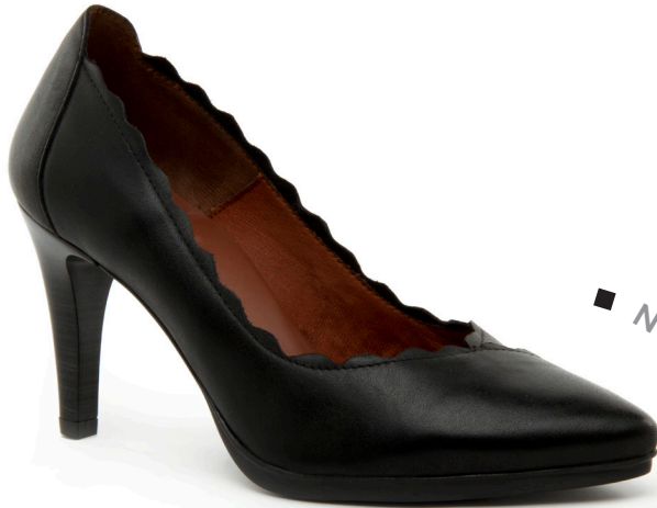
SARA 27 Diana