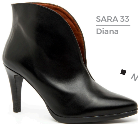
SARA 33 Diana