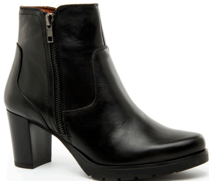
EURY 4 | Diana