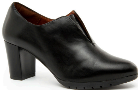
FURY 3 | Diana