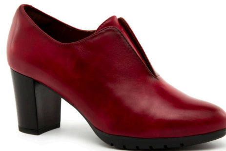
FURY 3 | Diana