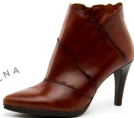
SARA 29 Diana