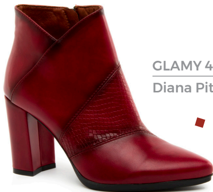
GLAMY 4 Diana Pitone