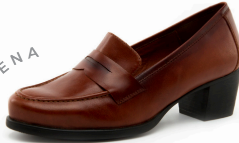
NEUS 3 Diana